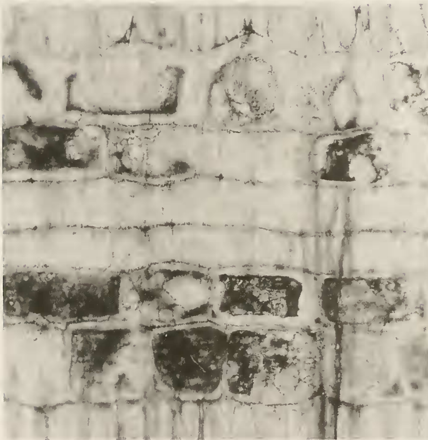
Abb. 9. Carapoxylon cf. xylocarpoides . Radialschliffe mit heterozellularen Holzstrahlen, rhomboiden Einzelkristallen und dunklen, amorphen Inhaltsstoffen. Oben, \times 280 ; untern, \times 420 .

onym X. obvatus (BL.) A. JUSS., hat dicke, korkartige Samenschalen. Die Früchte springen wie Granaten auf und geben die gut im Meerwasser schwimmenden Samen frei.